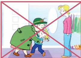
(Abb. Bildkarte aus Entdecken, schauen, fühlen! BzGA)

In unseren Einrichtungen lernen die Kinder »Stopp« zu sagen und zu zeigen! Die Kinder werden darin gestärkt ihren Gefühlen zu vertrauen. Sie werden darin gefördert ihre Bedürfnisse zu äußern z. B. wenn ihre Grenze von einem anderen Kind überschritten wird.